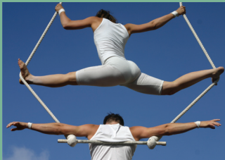
Fra forestillingen Cikaros