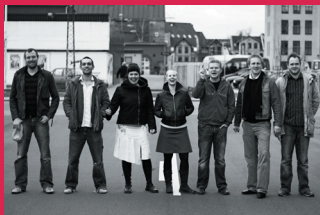
De syv 3. års elever